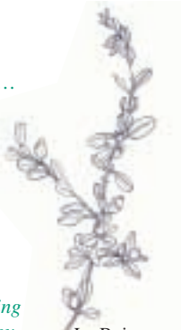
Le Buis ( Buxus sempervirens ) The common Box

It is also the Kingdom of a small family of Wood goblins ! They are really very welcoming despite being extremely discreet and shy. Besides it is Buchio who will guide you and introduce you to his Kingdom. Just follow the guide.